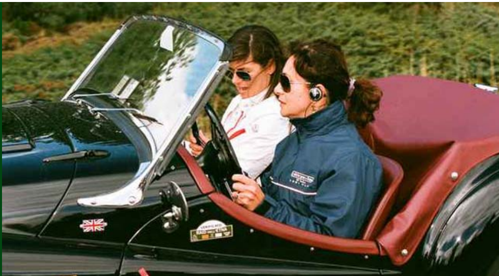
Coppa delle Dame Classifica 2008